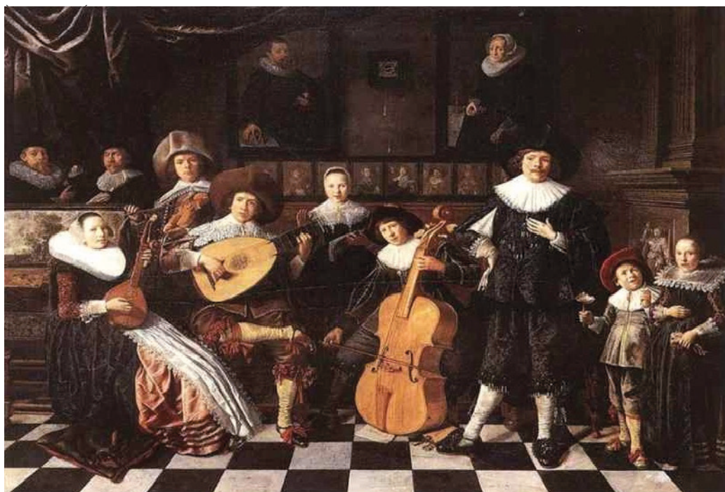
Рис. 2. Иллюстрация эпохи позднего Возрождения (XVI в.)

Теперь сопоставьте эту картину с сегодняшней зарисовкой жизни обычной семьи технообщества (рис. 3).